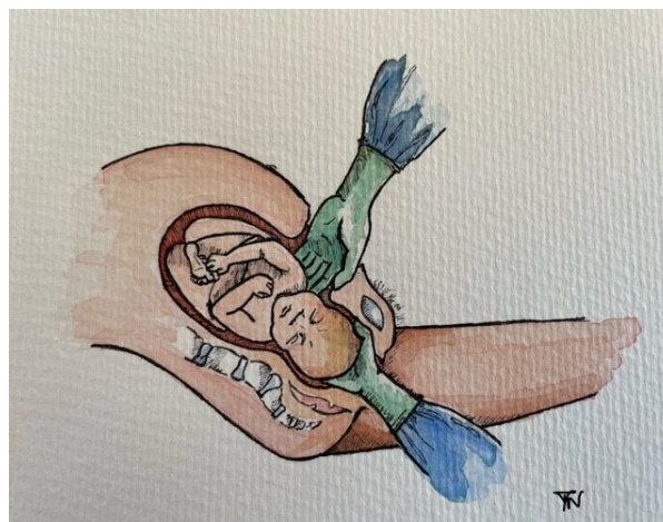
Billede 3: Skub nedefra Illustration: Josephine Maria Nolte©.

P Gravide der skal have foretaget sectio