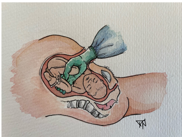
Billede 2: Fremtrækning på fod Illustration: Josephine Maria Nolte©.