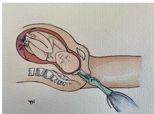
Billede 1: Anlæggelse af fetal pillow Illustration: Josephine Maria Nolte©.

Søgestreng: fetal pillow and caesarean section 13 studier er fremsøgt i PubMed, og referencelisterne for disse er ligeledes gennemgået. I alt ni studier gennemgås her.